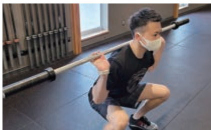
バックスクワット

バーベルをベンチに寝た姿勢で持ち、胸まで降ろして挙げる動作を20回くりかえすチャレンジです。