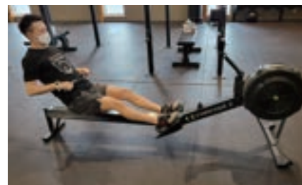
ローイングマシン

バーベルを肩で担ぎ、膝より深くしゃがんで立ち上がる動作を20回行うチャレンジです。