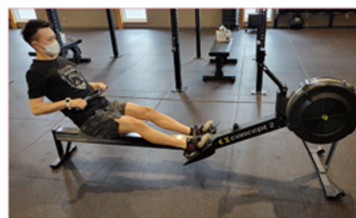
ローイングマシン

バーベルを肩で担ぎ、膝より深くしゃがんで立ち上がる動作を20回行うチャレンジです。