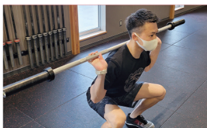
バックスクワット

バーベルをベンチに寝た姿勢で持ち、胸まで降ろして挙げる動作を20回くりかえすチャレンジです。